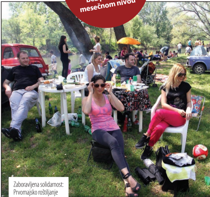
Zaboravljena solidarnost: Prvomajsko roštiljanje

Nezadovoljstva ima na sve strane, jer na desetine hiljada radnika ostaje bez posla na mesečnom nivou