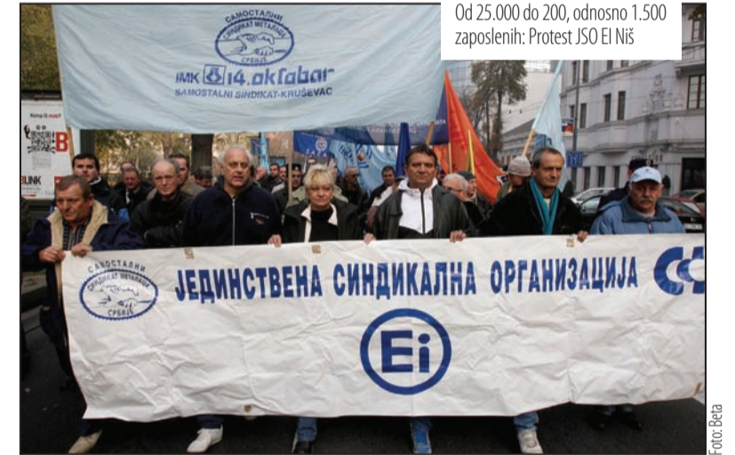
Od 25.000 do 200, odnosno 1.500 zaposlenih: Protest JSO EI Niš

više nisu mogle da se vrane na nekadašnje pozicije. Samo neke od njih mogu ponovo da postanu konkurentne, ali su za to potrebne investicije ili strateška partnerstva, ističe Ljubić i naglašava da se najveće nade polažu u reindustrijalizaciju i podseća da je pret-