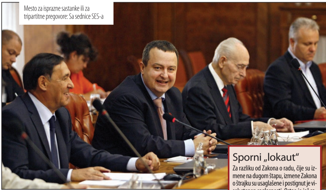
Mesto za ispravne sastanke ili za tripartitne pregovore: Sa sednice SES-a