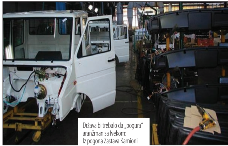
Država bi trebalo da „pogura“ aranžman sa Ivekom: iz pogona Zastava Kamioni

-Ukoliko se zaista želi deindustrijalizacija, onda rok za okončanje restrukturiranja u najznačajnijim domaćim fabrikama mora da bude produžen. Država mora najpre da osposobi te fabrike, da pokrene proizvodnju svugde gde je to moguće, i na taj način učini da do-