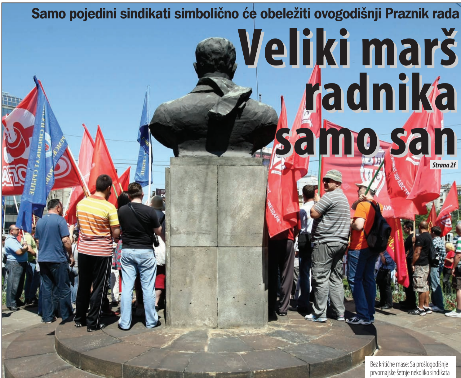
Bez kritične mase: Sa prošlogodišnje prvomajske šetnje nekoliko sindikata