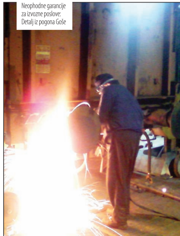
Neophodne garancije za izvozne poslove: Detalj iz pogona Goše

Na jugu Srbije brinu samo da očuvaju postojeći broj radnih mesta, iako većini firmi pretil kolaps