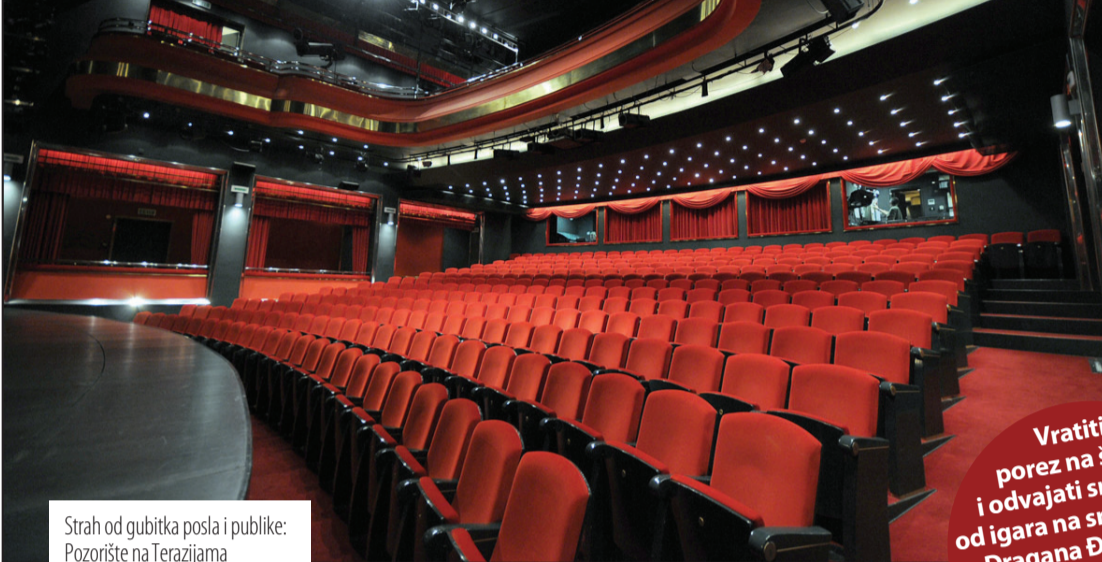
Strah od gubitka posla i publike: Pozorište na Terazijama