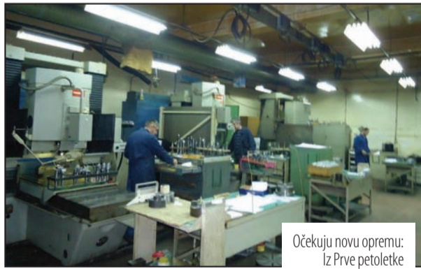
Očekuju novu opremu: Iz Prve petoletke

Ovo je, možda, prvi rezultat napora države da pomogne ovom preduzeću. Naime, država je intervenisala sa investicijom od 11 miliona evra, koja bi trebalo da se realizuje u toku ove i naredne godine. Međutim, plan države je da se, umesto klasičnih subvencija kojima se u Prvoj petoletki nadomešćuje višak troškova nad prihodima, ide na ulaganje u novu