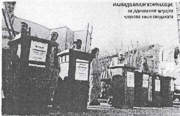
НАЈВИДЉИВИЈИ КОМУНАЛЦИ: са једносатног штрајка чланова више синдиката