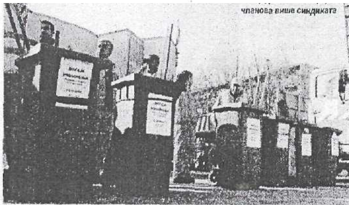
чланова више синдиката

пљени обавештењима о обустави рада и њеним разлозима.