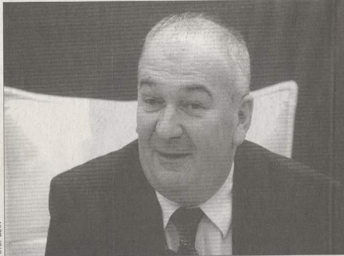
Orbović poručio da će biti izvršen pritisak na parlament

„Sve opcije ukazuju da je pogibeljno donošenje zakona po kom će radnicima plate