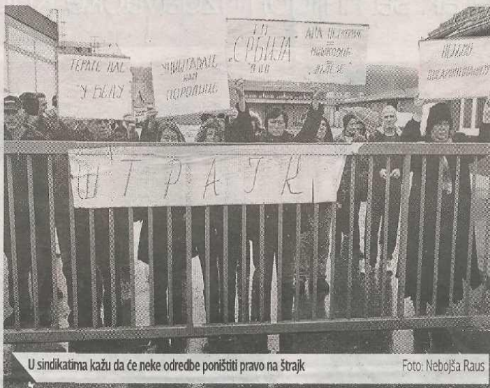
U sindikatima kažu da će neke odredbe poništiti pravo na štrajk