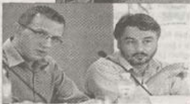
U trku ulazi pokret „Dveri“

Sindikati, privrednici, „Dveri“, Socijaldemokratski savez, svi žele u parlament