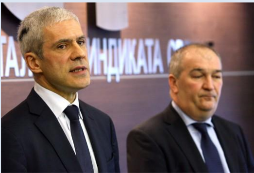
Избори у уставним оквирима

Највиши функционери Демократске странке и представници Савеза самосталних синдиката Србије разговарали су о економској ситуацији у земљи и искуствима у досадашњој сарадњи владе и синдиката, али, како је саопштено после састанка, две стране нису се бавиле питањем евентуалне политичке сарадње.